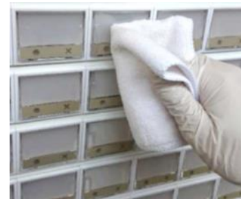
※施工作業中の写真

抗菌・抗ウイルス製品の普及などを目的とした第三者機関による証明書を取得済みの高純度ガラスコーティングにより、汚れや傷から守るだけでなく抗菌・抗ウイルス効果が期待されます。